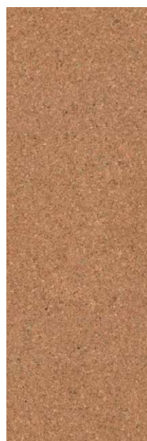
STANDARD STANDARD MASIV*