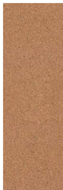
STANDARD MASIV COMPOSIT*